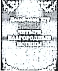
«Четыре благородные истины»

20 мин. III. Осмысление новой информации. Просмотр слайдов . Ученики с оставляют ассоциативную карту